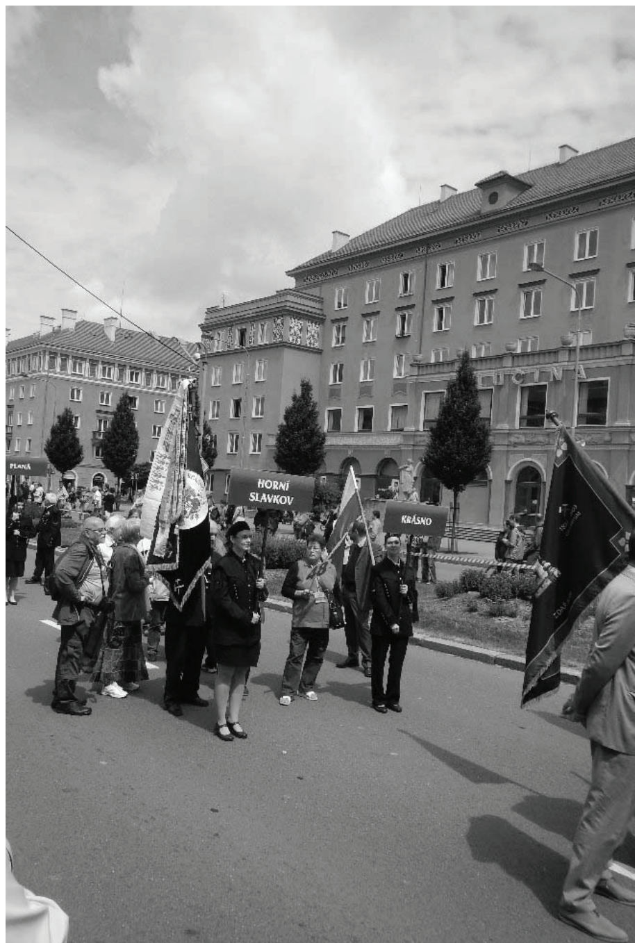
Setkání hornických měst v Havířově