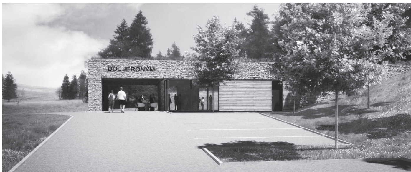
Pohled na Správní budovu od plánovaného parkoviště.

Tomíček Rudolf, hormistr Spolku horníků Barbora